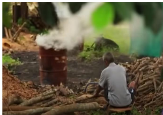
ภาพที่ 4 ความไม่สอดคล้องกับวิธีการผลิต