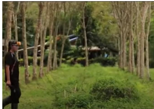
ภาพที่ 2 การฟื้นฟูภาคเกษตร ด้วยการส่งเสริมการปลูกยางพารา (ที่มา : สำนักข่าวไทย TNAMCOT, 2559)