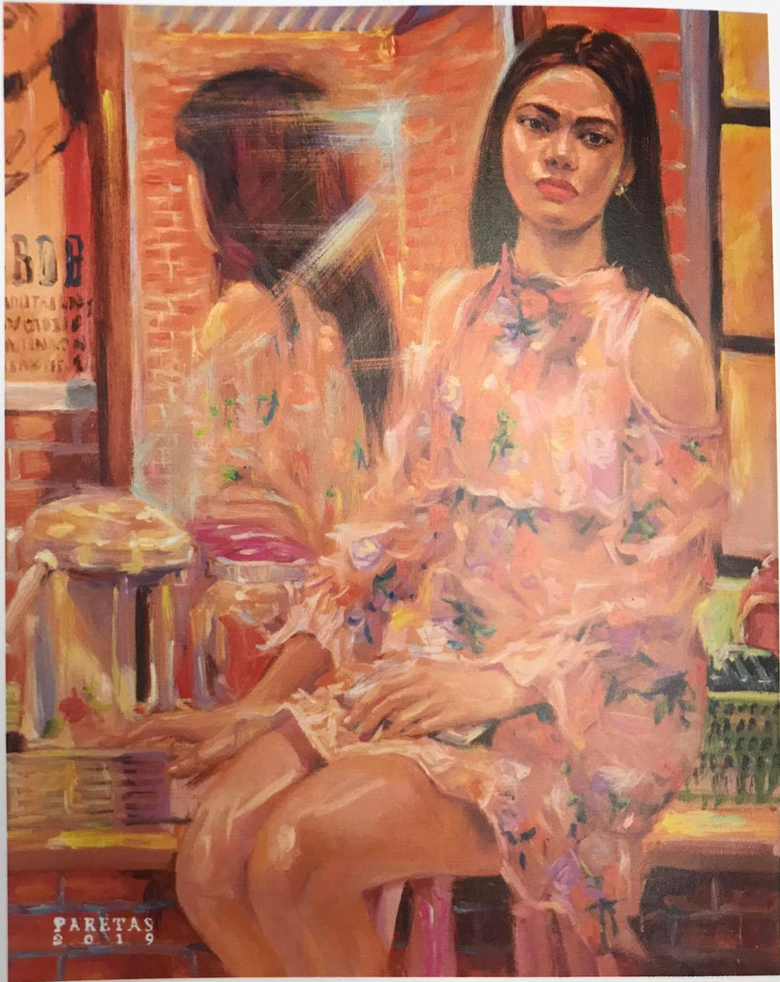
ปริทรรศ หุตางกูร / Paritas Hutangkul Cream&Butter Oil on canvas, 80 x 100 cm.