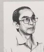
พิชัย นีรันต์ Pichai Nirand