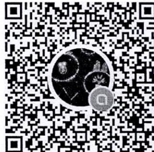
QR Code กลุ่มไลน์การอบรม