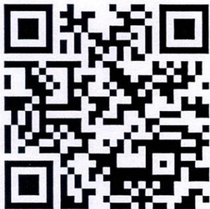
QR Code ในการสมัคร

เว็บไซต์สมาคมรัฐประศาสนศาสตร์แห่งประเทศไทย www.thaipaata.com หรือสมัครผ่านการสแกนผ่าน QR Code และแนบหลักฐานการชำระเงิน โปรตระบุชื่อ นามสกุลผู้ประสงค์จะเข้ารับการอบรม หรือสมัครจากลิงก์ https://forms.gle/sHhkCs83DD3PdJZVA