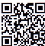
แบบประมวลประวัติฯ

ฝ่ายเลขานุการคณะกรรมการสรรหาอธิการบดีมหาวิทยาลัยราชภัฏธนบุรี