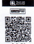
สแกนเข้าบัญชีเงินฝากสำนักงาน ป.ป.ช. (กฐินพระราชทาน) โดยใช้ Net Bank ได้ทุกธนาคาร