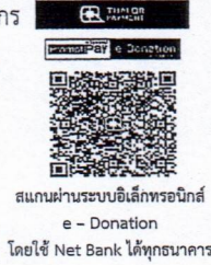
สแกนผ่านระบบอิเล็กทรอนิกส์ e - Donation โดยใช้ Net Bank ได้ทุกธนาคาร